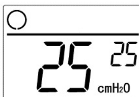
図3 液晶画面(25cmH 2 O設定使用時)