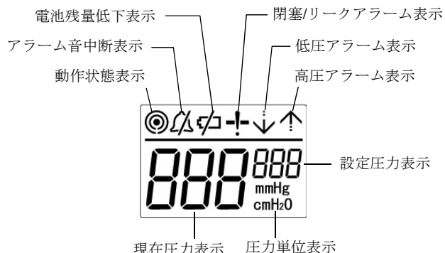
図2 液晶画面(全点灯時)