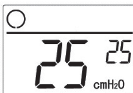
図3 液晶画面(25cmH 2 O 設定使用時)